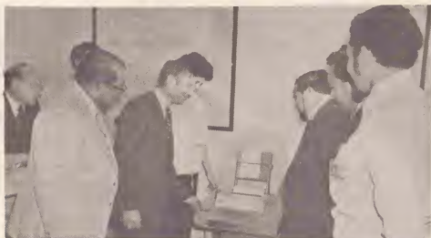
Ministro-presidente di Hulanda A. van Agt ta inaugura "flight information center" na aeropuerto.

Tumando na cuenta cu e aeropuerto internacional ta di importancia vital pa e industria turistico di Aruba, Gobierno Insular a entama varios proyectonan pa expande y modernisa e aeropuerto.